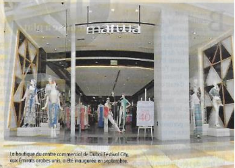
Le boutique du centre commercial de Dubai Festival City, aux Émirats arabes unis, a été inaugurée en septembre.

Pour le dirigeant, le choix de se focaliser sur les pays arabes s'explique d'abord par une certaine homogénéité