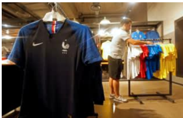
Eclat Textiles is specialized in making high-end fabrics and turns them into sports clothing for Nike, Lululemon, Under Armour, Polo Ralph Lauren, Victoria Secrets, Adidas as well as retailers

The company specializes in making high-end fabrics and turning them into sports clothing for brands including Nike, Lululemon, Under Armour, Polo Ralph Lauren, Victoria's Secrets and Adidas as well as retailers such as JC Penney, Kohl's and Target.