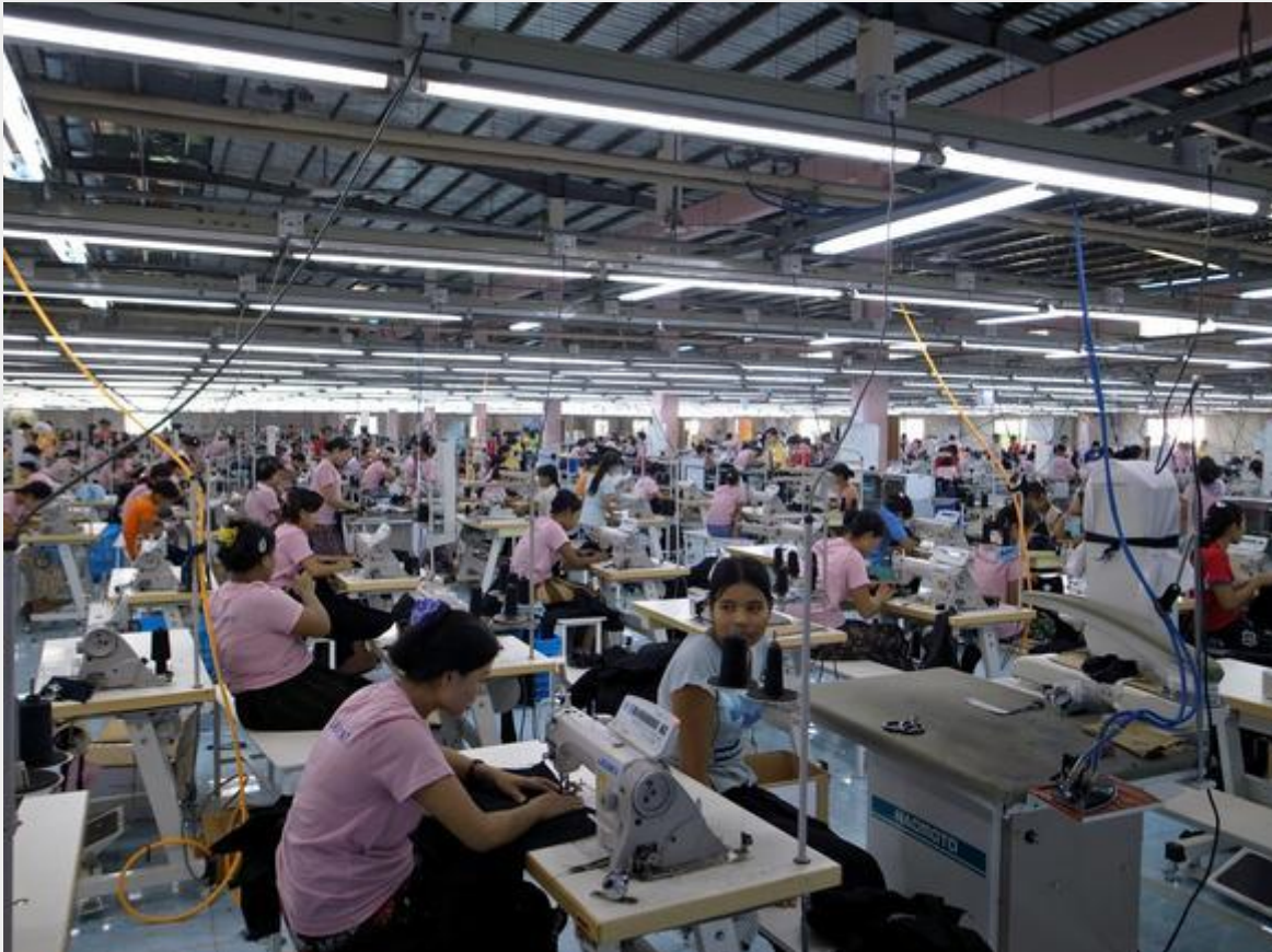
Workers sew garments at a Japanese plant in Myanmar.

TOKYO -- China's textile exports fell for the first time in six years in 2015, dragged down by the sluggish economies of export destinations, rising labor costs in China as well as an increase in overseas investment.